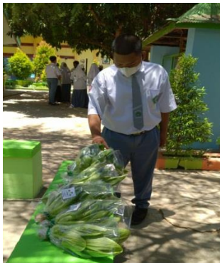
Gambar 3. Hasil hidroponik siswa MAN Sumenep yang akan dijual kepada masyarakat setempat

Kemudian kolaborasi juga dilakukan bersama masyarakat. Siswa MAN Sumenep memiliki peran untuk berkolaborasi dengan masyarakat dengan mengenalkan hasil produksinya yaitu pembudayaan tanaman melalui hidroponik. Siswa dibina oleh guru untuk merawat tanaman hidroponik dan hasilnya akan dijual kepada masyarakat luas. Masyarakat merespon positif dari hasil yang dikembangkan oleh siswa, sehingga mereka membelinya dengan harga yang terjangkau.