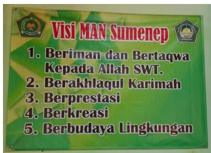
Gambar 1. Visi berbudaya lingkungan yang disepakati oleh seluruh warga MAN Sumenep

Pembiasaan ini disepakati secara bersama dalam bentuk visi sekolah yaitu berbudaya lingkungan. Visi berbudaya lingkungan di MAN Sumenep disepakati secara bersama, sehingga timbul ikatan untuk membentuk kultur sekolah dalam menjaga lingkungan hidup. Kultur sekolah menurut Deal dan Petterson sebagai keyakinan dan nilai-nilai milik bersama yang menjadi pengikat kuat kebersamaan sebagai warga suatu masyarakat. 10 Dengan adanya visi berbudaya lingkungan yang dimiliki oleh MAN Sumenep maka terbentuklah kultur madrasah yang peduli dengan lingkungan. Kultur madrasah peduli lingkungan diwujudkan dengan adanya program adiwiyata.