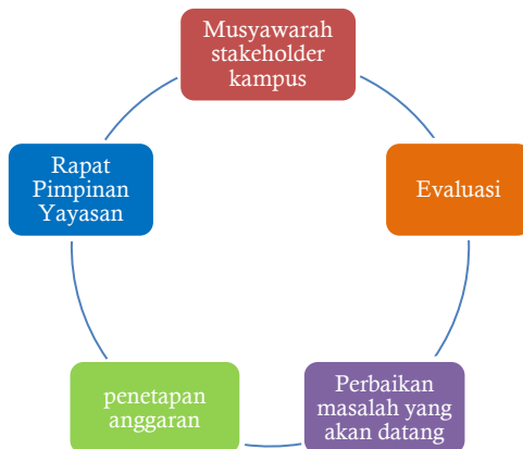
Gambar 1 Langkah-Langkah Perencanaan Universitas Islam Malang

Program perencanaan anggaran pendidikan UNISMA dituangkan dalam bentuk penyusunan rencana anggaran pendapatan belanja perguruan tinggi (RAPBPT) yang disusun berdasarkan kesepakatan bersama. Sebagaimana